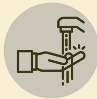
Lava tus manos Wash your hands