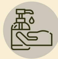
Desinfecta tus manos Desinfect your hands