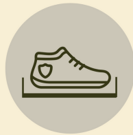
Desinfecta tu calzado Desinfect your footwear