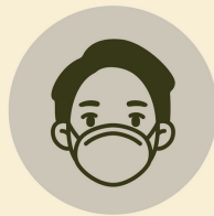
Usa mascarilla Wear mask

Adecuamos en el ingreso a Sisakuna Lodge un área para lavado y desinfección de manos, desinfección de calzado y toma de temperatura.