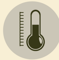
Controla tu temperatura Check your temperature